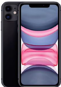
iPhone 11, 256GB Negro