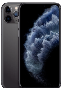
iPhone 11 Pro 256GB Gris Espacial