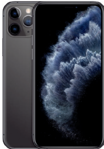
iPhone 11 Pro 512GB Gris Espacial