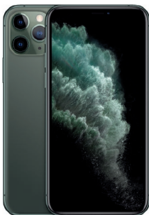
iPhone 11 Pro 64GB Verde media noche