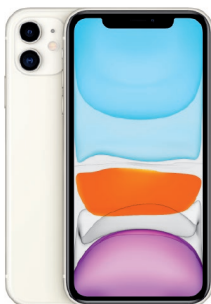
iPhone 11 64GB Blanco