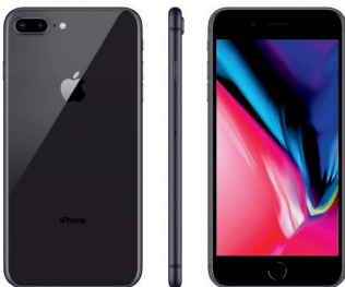
iPhone 8 Plus, 64GB Gris Especial