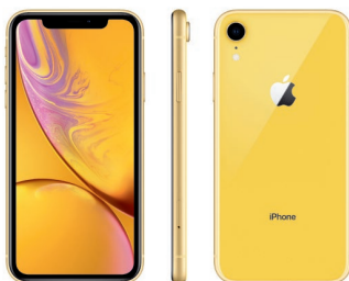
iPhone XR de 128 GB, Amarillo