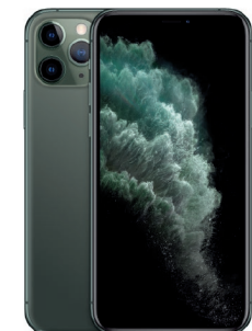
iPhone 11 Pro Max 256GB Verde media noche