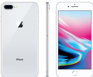
iPhone 8 Plus, 64GB Plata