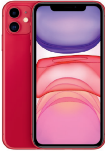
iPhone 11, 256GB Red