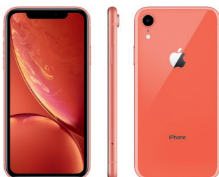
iPhone XR de 128 GB, Coral