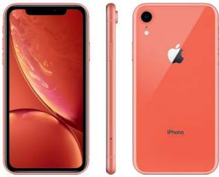
iPhone XR de 256 GB, Coral