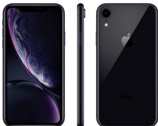
iPhone XR de 256 GB, Negro