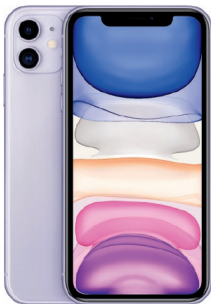
iPhone 11, 256GB Morado