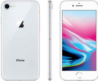
iPhone 8, 64GB Plata