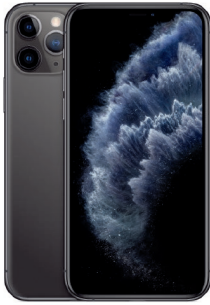
iPhone 11 Pro 64GB Gris Espacial