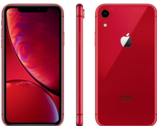
iPhone XR de 128 GB, Rojo