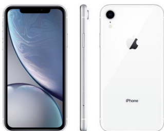
iPhone XR de 256 GB Blanco