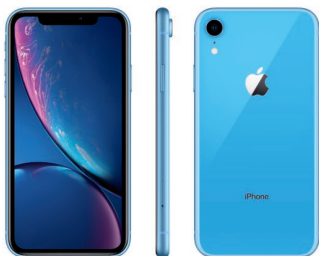
iPhone XR de 128 GB, Azul