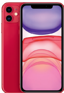
iPhone 11 64GB Red