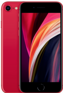
iPhone SE 256GB Red