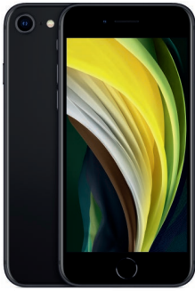
iPhone SE 256GB Negro