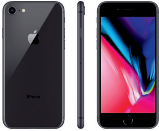
iPhone 8, 64GB Gris Especial