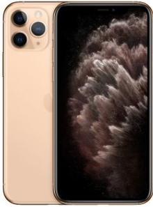
iPhone 11 Pro 256GB Oro