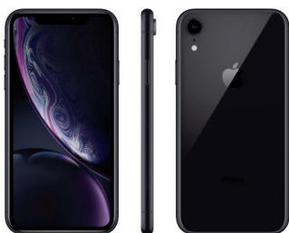
iPhone XR de 128 GB, Negro