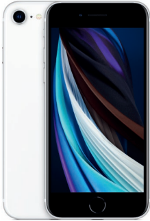
iPhone SE 256GB Blanco