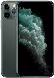
iPhone 11 Pro 256GB Verde media noche