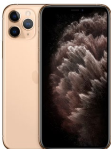
iPhone 11 Pro Max 64GB Oro