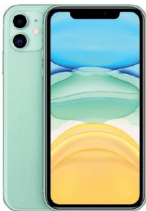
iPhone 11, 256GB Verde