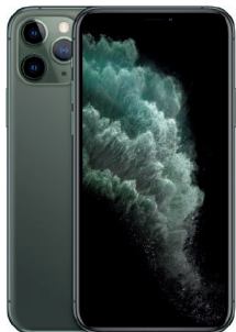
iPhone 11 Pro Max 512GB Verde media noche