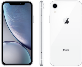
iPhone XR de 128 GB Blanco