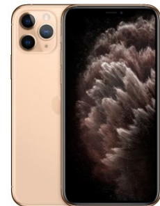
iPhone 11 Pro Max 256GB Oro