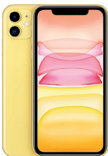
iPhone 11, 256GB Amarillo