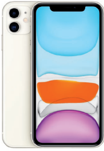
iPhone 11, 256GB Blanco