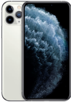
iPhone 11 Pro 256GB Plata